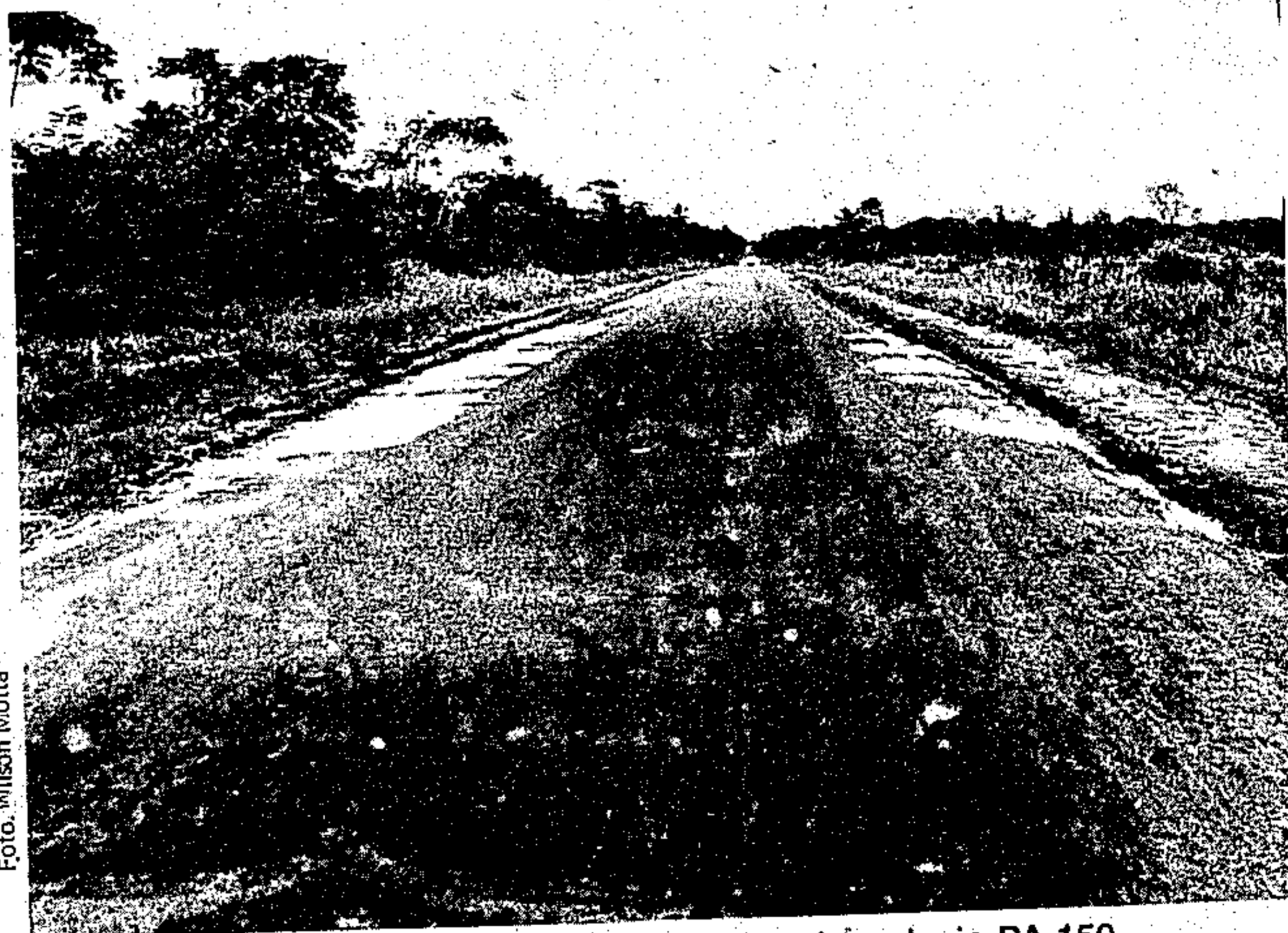
Uma parte dos 80 quilômetros já asfaltados da rodovia PA-150

equipamentos, inclusive uma auto-ambulância.