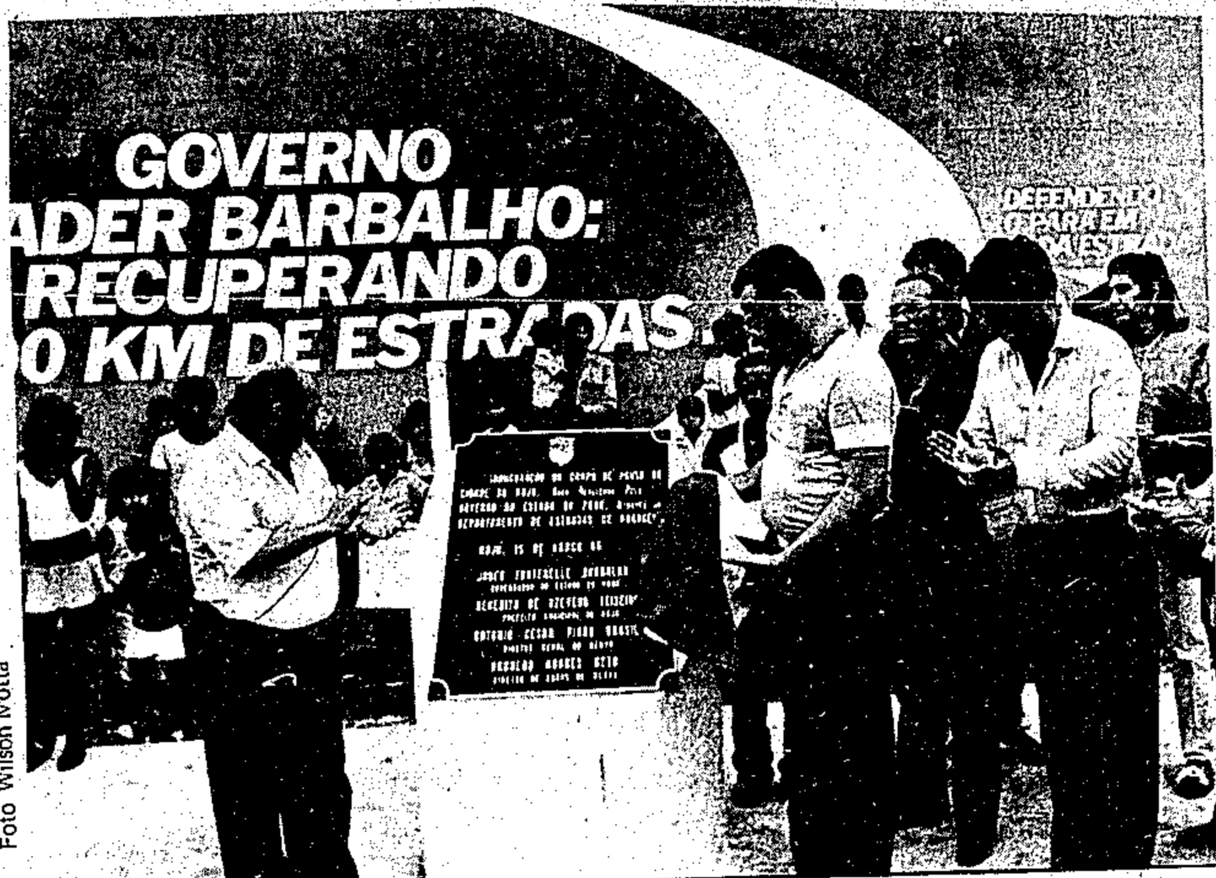
O governador Jader Barbalho inaugura o campo de pouso de Moju

No elenco de compromissos assumidos pela atual administração estadual, quanto a Tailândia, figuram, também, as seguintes realizações programadas para um futuro próximo: instalação, pela Sespa, de um posto de saúde, que será dotado de servidores especializados e contará com o máximo possível em