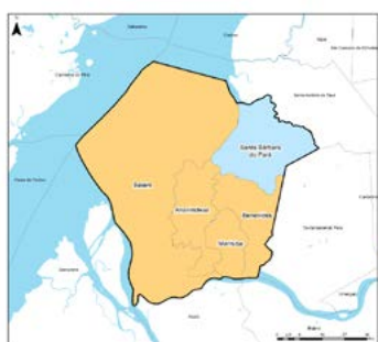
Figura 01 – Principal Atividade na Composição do Valor Adicionado do Município, excluindo a Administração Pública – Região de Integração Guajará e municípios, 2021.