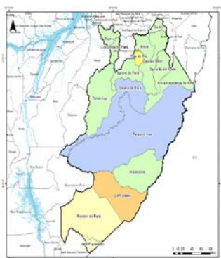
Figura 01 - Principal atividade na Composição do Valor Adicionado do Município, excluindo a Administração Pública - Região de Integração Rio Capim, 2021.

Fonte: IBGE e FAPESPA, 2023. Elaboração: FAPESPA, 2025.