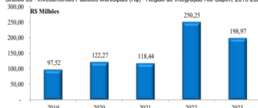
Gráfico 05 - Investimentos Públicos Municipais (R$) - Região de Integração Rio Capim, 2019-2023.

Fonte: Fibra, 2025. Elaboração: FAPESPA, 2025. Nota: Valores corrigidos pelo IPCA a preços de 12/2024.